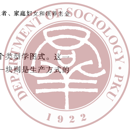
表 3 列出了资本主义社会中此类复杂阶级位置的一个类型学图式。这一类型学可以分成两大块：一块是生产方式的所有者，另一块则是生产方式的