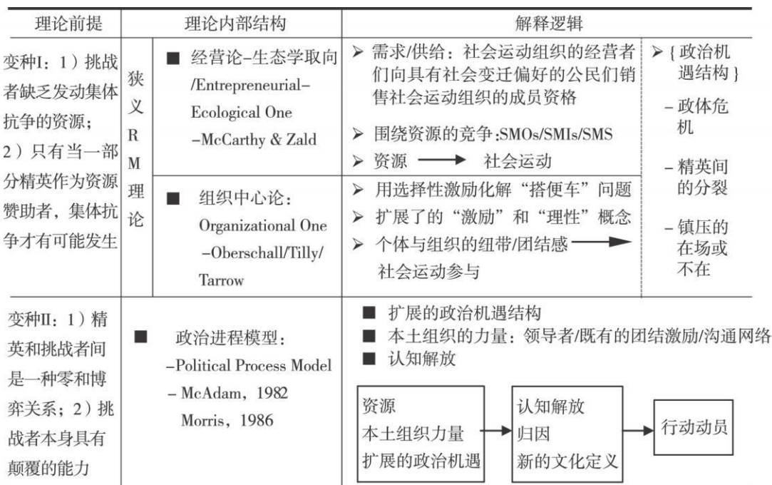
图 3 主流理论的内部分化及其解释逻辑

图 3 显示, 精英论政治观的变种 指明了精英和挑战者之间可能存在的一种合作关系, 而变种 I 则指明了, 挑战者需要依靠本土社区的资源, 才能发起向精英的政治挑战。前者催生了资源动员理论的诞生, 其内部又分化为经营论-生态学取向和组织中心论取向; 后者则最终演化为政治进程模型, 用于说明黑人民权运动之类的本土社区的政治反抗。